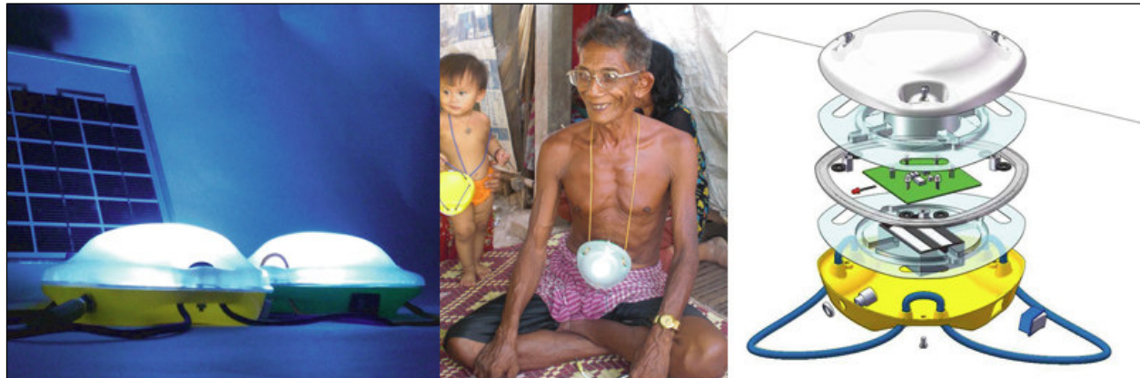
MOONLIGHT – מתוך הרצאתו של ג'יי.סי. דיל

לפרטים נוספים: http://portal.anhembi.br/sbds/anais/art_palestrantes.htm http://www.research.philips.com/newscenter/pictures/misc-sustainability.html