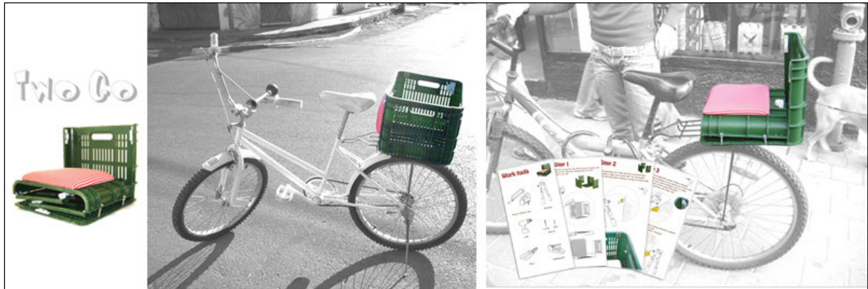
TWOGO סל ומושב אופניים בשיטת DIO (DO IT OURSELVES) עיצוב: יעל ליבנה בהנחיית פרופ' גד צ'רני, מכון טכנולוגי חולון.