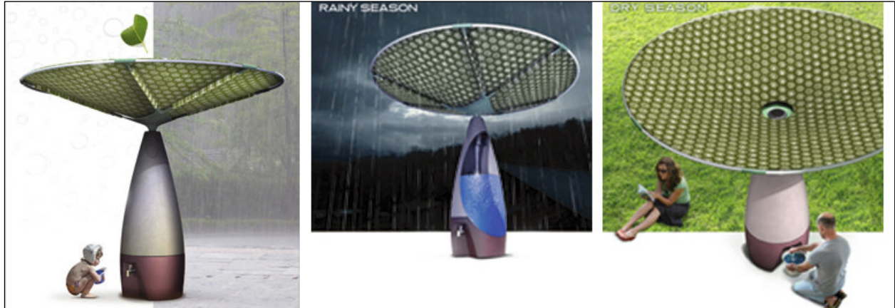
WATERFULL באר עילית לאיסוף מי טל ומי גשם. עיצוב: עדיטל אלה ועודד דידוביץ

http://www.aditalela.com/publications.html